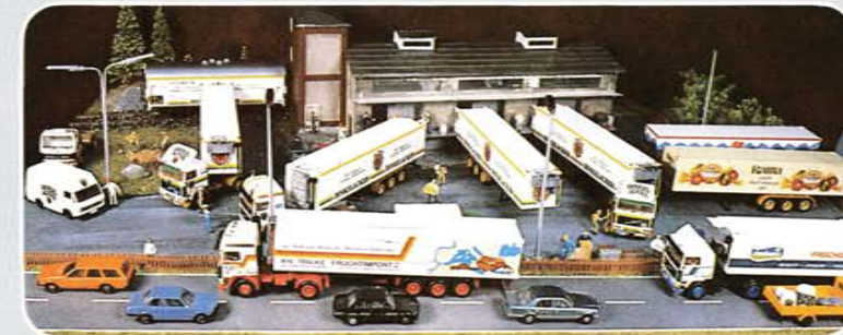
Alle mit Punkt gekennzeichneten Modelle sind im Herbst 1981 erhältlich.

Alle Modelle haben eine garantiert limitierte, in der jeweiligen Stückzahl angegebene Auflage. Änderungen, sowie alle Rechte und Modellverbesserungen bei allen Artikeln behalten wir uns vor. Lieferung nur solange Vorrat reicht. Neuaufgaben der abgebildeten Modelle nicht möglich. Modelle 100 101-100 112, 400 101 auf herpa-Basis.