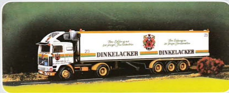
© Best.-Nr. 300 102 Zurüstset Dinkelacker: 2 Kühlaggregate, Stoßstange hellbraun, komplettes Fahrerhaus „Globetrotter“, Spoiler, Sonnenblende, Abziehbilder, Fanfaren, Fahrer und Beifahrer, Windleit- bleche, Blinker, Leuchten, Rückspiegel.