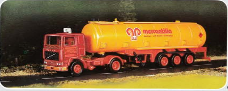
Serie 4 © Best.-Nr. 100 111 Volvo F 12 Tankzug, Mercantilia Spedition Druck/Abziehbild Auflage: 5000 limitiert