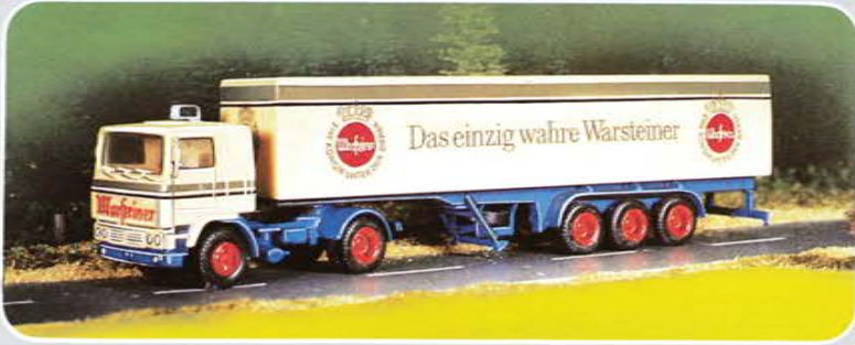
Serie 3 © Best.-Nr. 100 109 Volvo F 12 Container, Orig. Zug Warsteiner-Brauerei Fertigmodell Druck/Abziehbild Auflage: 5000 limitiert