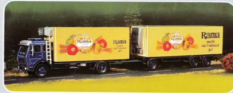
© Best.-Nr. 200 101 Bausatz „Rama“