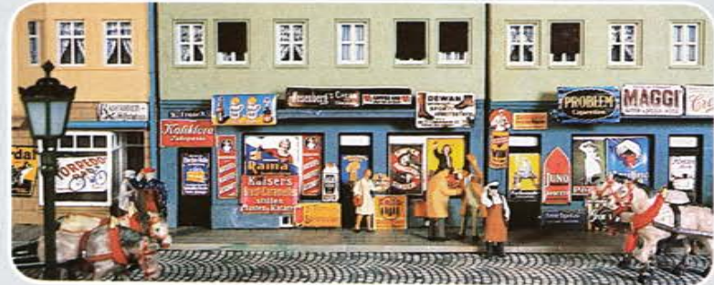
Motiv mit Werbetafeln