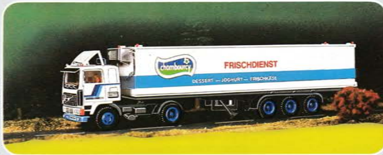
© Best.-Nr. 300 101 Zurüstset Chambourcy: 2 Kühlaggregate, Stoßstange blau, blaue Radsätze (5 Paar Felgen), Spoiler, Sonnenblende, weißes Fahrerhaus mit Inneneinrichtung, VOLVO-Streifen, Abziehbilder, Fanfaren, Fahrer und Bei- fahrer, Windleitbleche, Blinker, Leuchten, Rückspiegel.