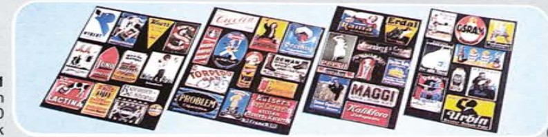
© Best.-Nr. 500 101 Werbetafeln zwischen 1930 und 1950 1 Tableau, 44 Stück