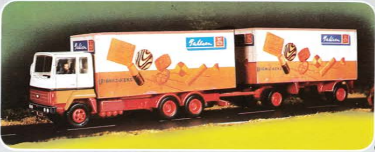
Serie 4 © Best.-Nr. 100 110 Ford Transconti mit Hänger, Bahlsen Fertigmodell Abziehbild Auflage: 5000 limitiert