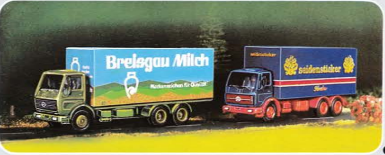
Serie 4 © Best.-Nr. 100 112 2mal Daimler-Benz ohne Hänger, Seidensticker/Breisgau-Milch 6fach bedruckt/Abziehbild Auflage: je 5000 limitiert 1 Packung