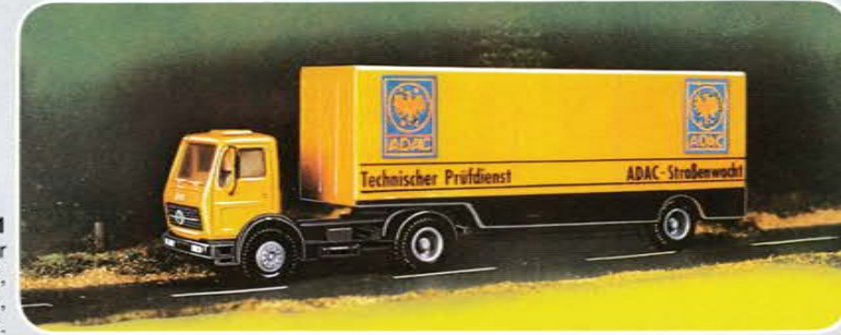
© Best.-Nr. 400 101 ADAC-Technischer Prüfdienst, bedruckt, Auflage: 2000 limitiert.