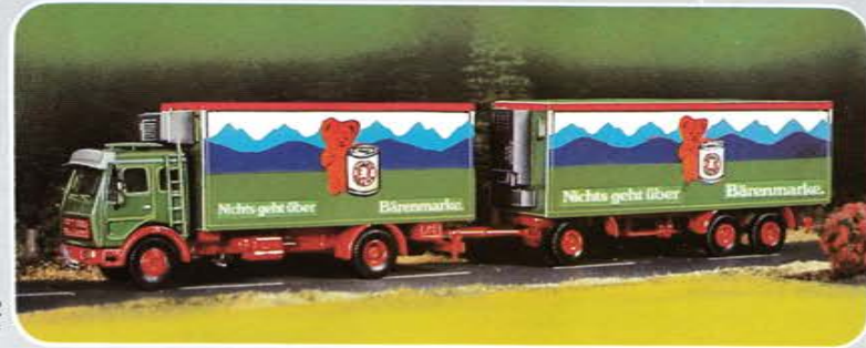
© Best.-Nr. 200 102 Bausatz „Bärenmarke“