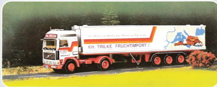
© Best.-Nr. 300 103 Zurüstset KH. TRILKE: 2 Kühlaggregate, komplettes Fahrerhaus mit „Globetrotter“-Aufbau, Seitenstreifen mit Text, rote Stoßstange, Abziehbilder, Windleitbleche, Fanfaren, Fahrer und Bei- fahrer, neuer Ansaugstutzen, Leuchten, Sonnenblende, Rückspiegel.

Alle Zurüstsätze enthalten außerdem 2 Zeichen TIR, 2 Zeichen Fernschnellgut, 2 Zeichen Güterkraftverkehr und 9 Kennzeichen.