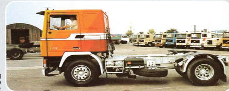
In Vorbereitung Mehrfarbig bedruckte VOLVO F 12 Fahrerhäuser